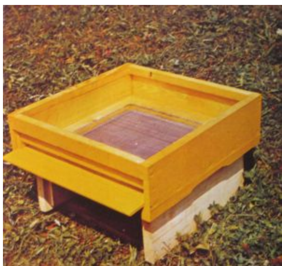
Kočovné dno k úlu Optimal