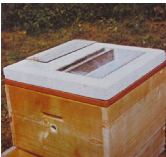
Uteplené vrchní krmítko