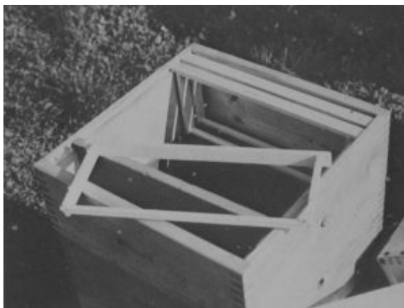
Nástavek, rámký (s mezerníky) a svislá přepážka. U rámký je patrná užší spodní loučka