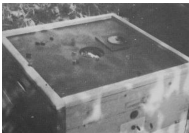
Vnitřní kryt úlu - víceúčelová přepážka, s uzavíratelným otvorem. Otočením přepážky lze vytvořit vyšší nadrámečkový prostor pro dodávání bílkovinného těsta